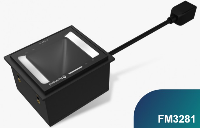
FM3281 Grouper Escáneres fijos